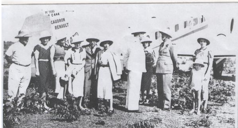
En haut : Goéland d'Air Afrique à Mopti (Soudan 1937).